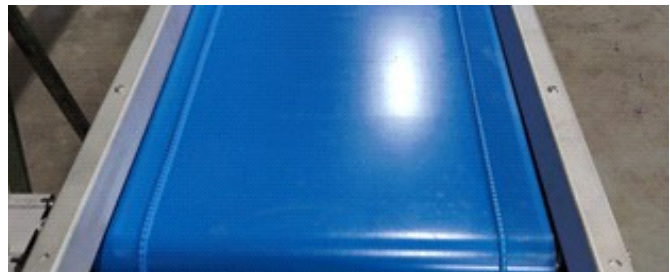
pasillos de residuos al aire libre